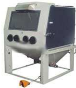
Beispiel AQUABLAST 1515