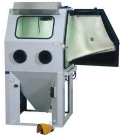
Beispiel AQUABLAST 915